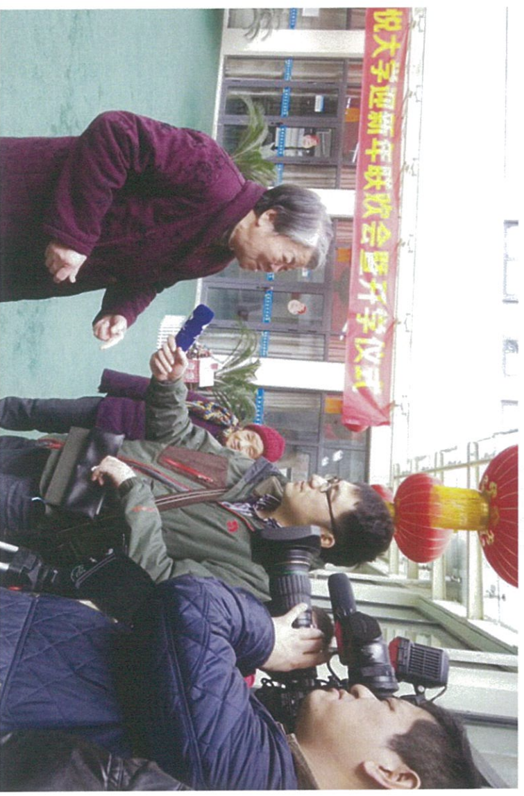
图 3：江苏卫视采访南京安康老年养老服务中心