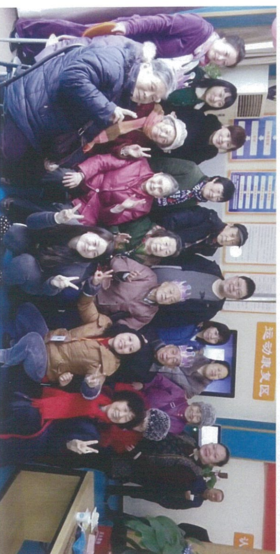
图 2: 过街楼社区活动