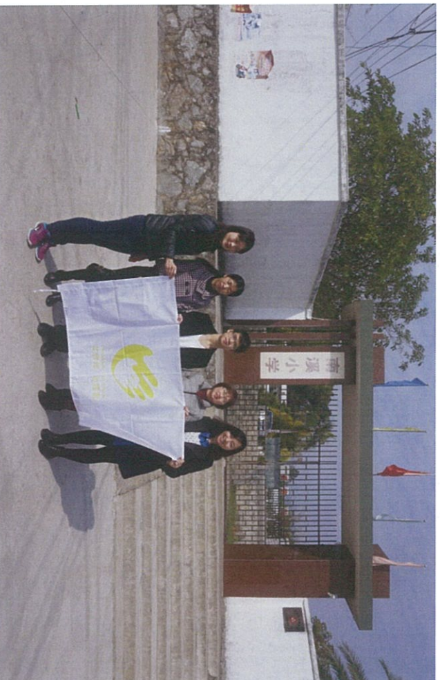
图：基金会与博罗县团委在南溪小学合影留念