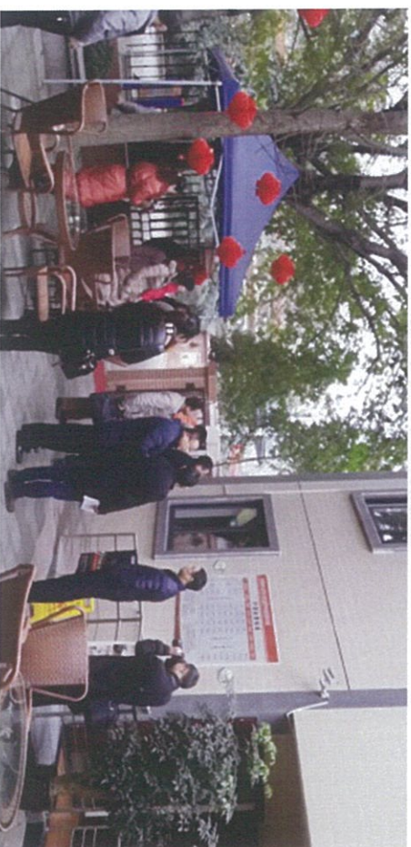
图 5：四川省委相关部门，成华区民政局、老龄办及双桥街办等监督员视察