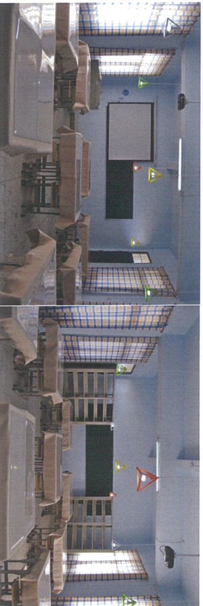
图：现旗舰版七彩小屋建设