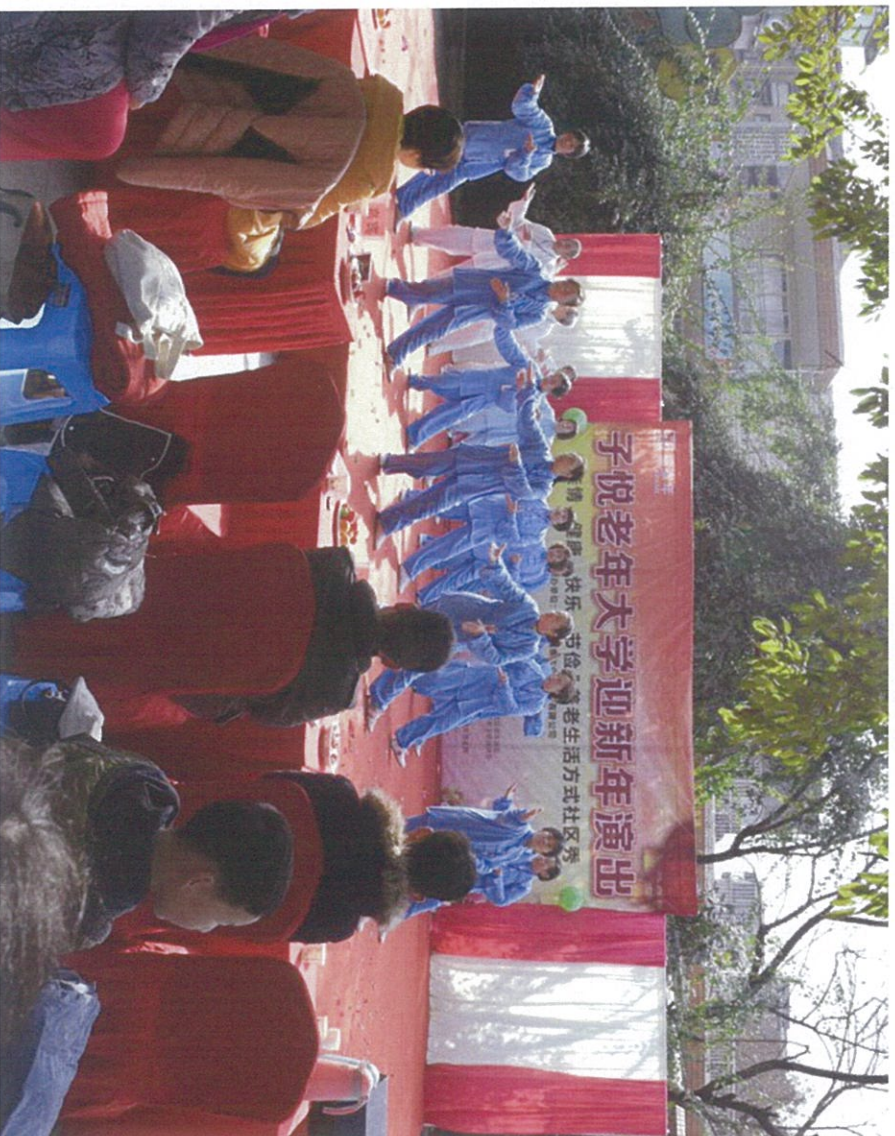
图 1：子悦大学迎社区新年演出