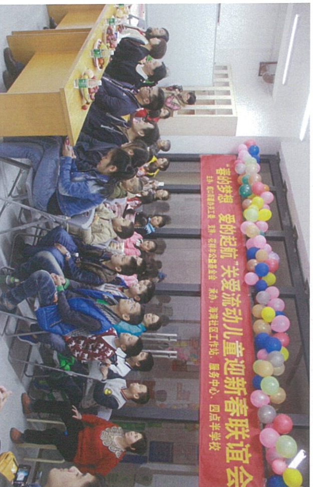
图：“春的梦想·爱的起航”关爱流动儿童迎新新春活动现场

花样年志愿者表演的口琴《友谊地久天长》及独唱《甜蜜蜜》深受现场学生的喜爱及领导的赞扬，四点半学校学生一同表演的手语剧《感恩的心》获得了全场最热烈的掌声。此次活动意在展现流动儿童风采，培养其感恩意识，并让花样年志愿者积极参与公益活动，关注、了解流动儿童生活状态。