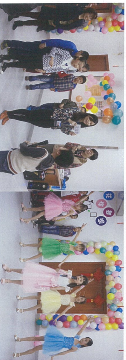
图：四点半学校学生与志愿者一起表演和互动