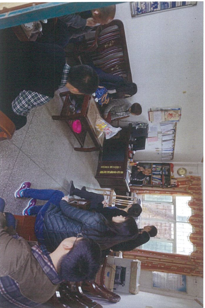
图：基金会工作人员认真听取校方介绍南溪小学七彩小屋使用现状

1月29日，花样年公益基金会前往广东省惠州市博罗县南溪小学实地开展旗舰店七彩小屋调研工作，并与博罗县团委及校方领导深入探讨花样年旗舰店七彩小屋建设标准、建设形势，已基本确定建设了内容：多媒体设备（含电脑）、七彩桌椅、音体美教学教具、七彩小屋室内粉刷及七彩课堂活动费用等，最终确定南溪小学整体建设费用约为30000元。博罗县团委许诺将严格按照花样年旗舰店建设标准监督校方实施建设，并向花样年公益基金会定期反馈建设情况及验收信息。