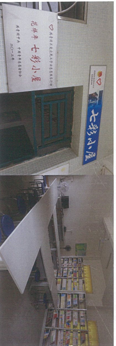
图：南溪小学七彩小屋现状