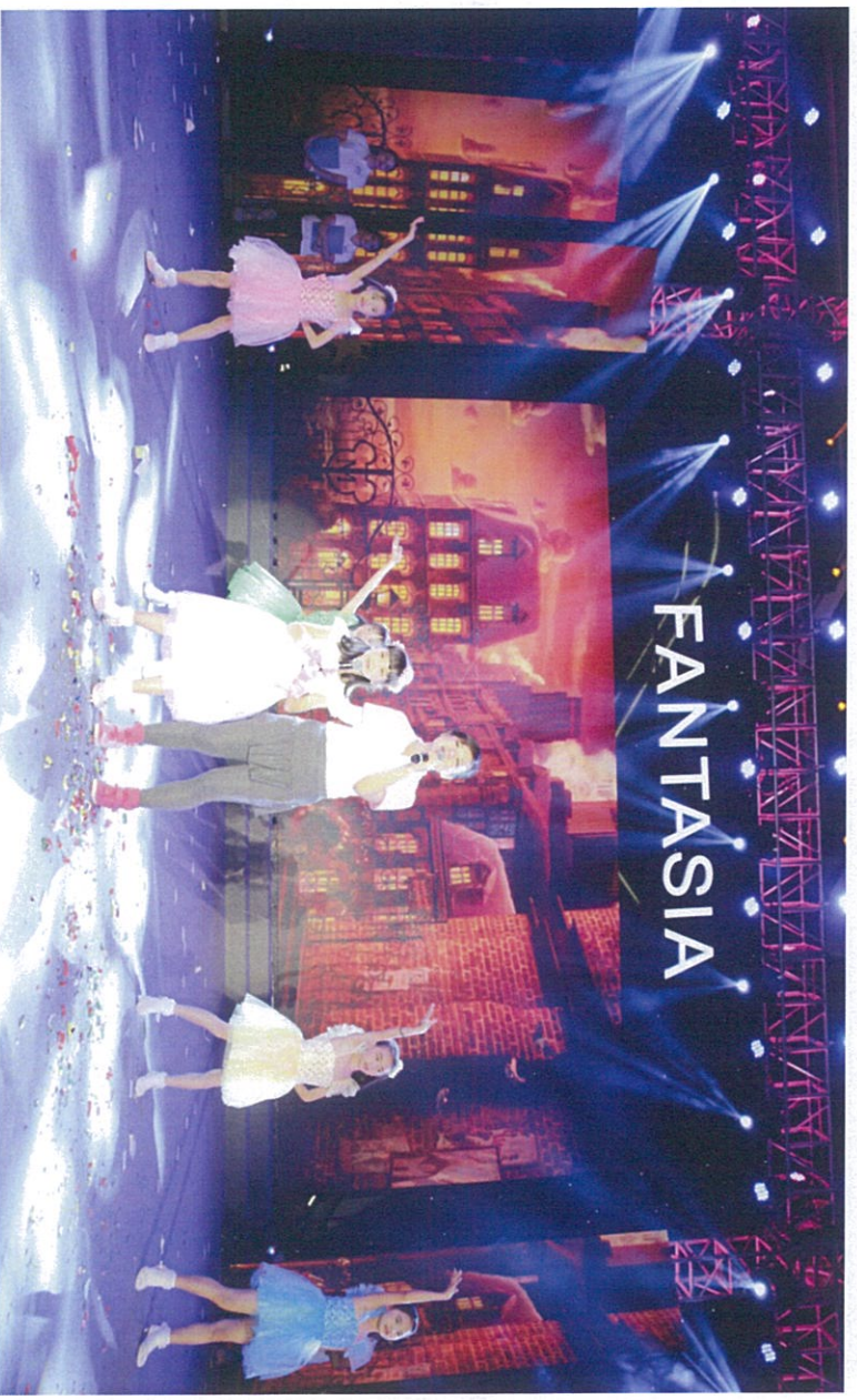
图：花样年志愿者朗诵诗歌《你不来，我不老》和四点半学校学生歌舞表演《彩虹的约定》

深圳蛇口海湾社区四点半学校是花样年公益基金会第一批旗舰版七彩小屋升级学校，也是市试点学校。学校成立于 2008 年 6 月，主要解决外来子女放学后失管失教的问题，目前，四点半学校学生近百名，成立至今服务学生达 16000 余次，义工教师服务达 2000 余次。未来，花样年公益基金会将通过旗舰版七彩小屋为活动平台，长期利用线上远程课堂及线下七彩课堂的互动方式不断地向四点半学校输入更多优秀的花样年志愿者导师。