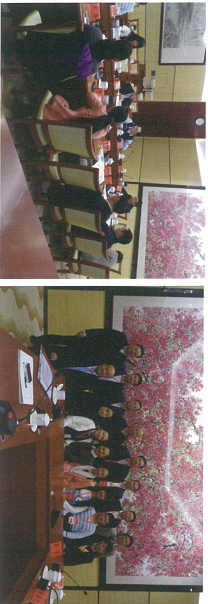
图：基金管理与社会合作委员会分组讨论会现场