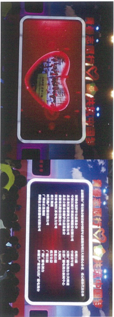
图：花样年公益基金会活动图片展示及爱心企业获奖名单（左列第一个）