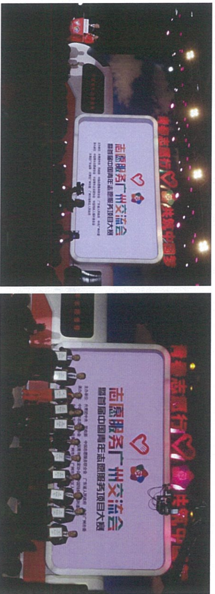
图：民政部副部长宫蒲光颁发爱心企业奖（左侧第一个：花样年公益基金会代表）

12月4日，花样年公益基金会受邀参加在广州市保利世贸博览馆举行的“第四届志愿服务广州交流会暨首届中国青年志愿服务项目大赛颁奖典礼”，中共中央政治局原委员、中国志愿服务联合会会长刘淇，团中央书记处常务书记贺军科，团中央书记处书记汪鸿雁，民政部副部长宫蒲光，中国残联副主席吕世明，省委常委、宣传部部长庹震等出席颁奖典礼，并为获奖的志愿者、志愿者组织和志愿服务项目颁奖。