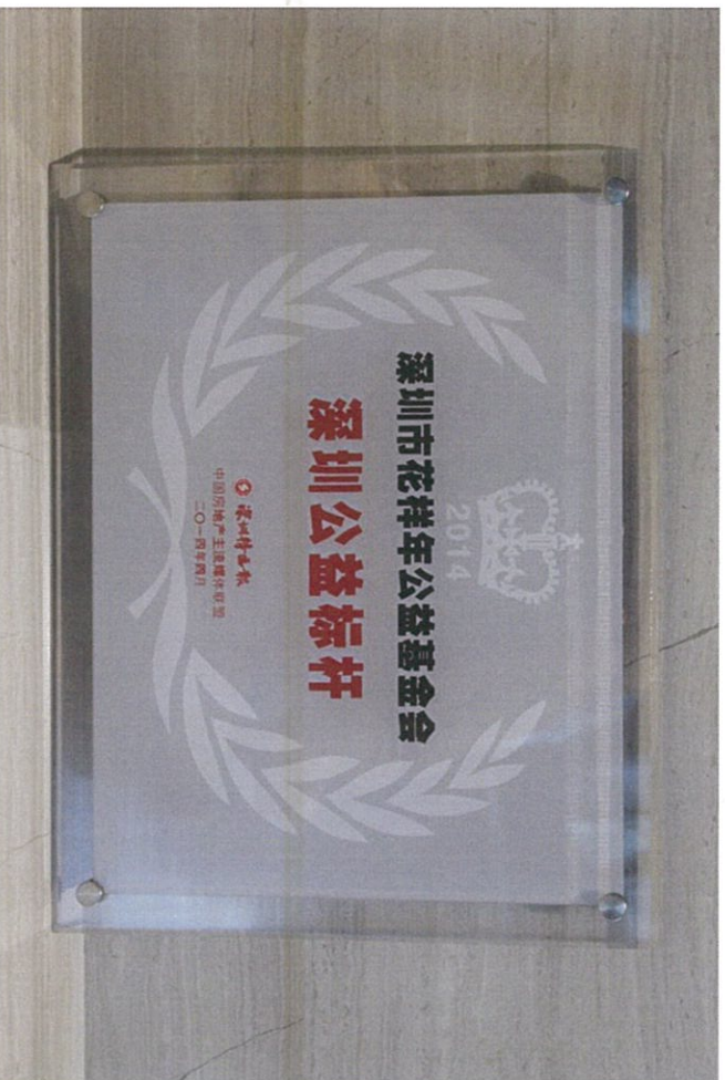
图：喜获“深圳公益标杆”

近日，花样年公益基金会在由《深圳特区报》等机构推选出“2014 深圳新地标”活动中，喜获“深圳公益标杆”殊荣。