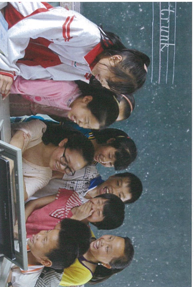
图：花样年公益基金会的支教老师与孩子们互动

深圳作为志愿者之城、爱心之城，以“深圳向上”的爱心姿态，诞生了壹基金、花样年公益基金会等透明务实的公益机构，引领中国公益慈善新的潮流，为文明城市描画幸福底色。