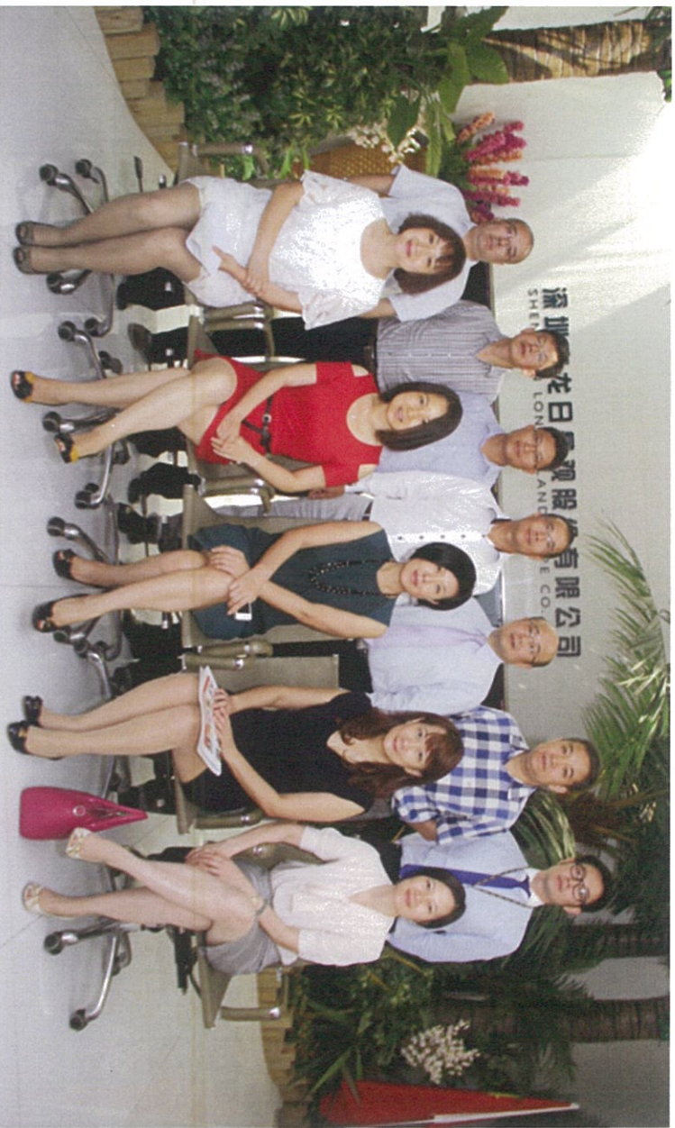
图：公益基金会领导与龙日园艺领导及同事合影留念