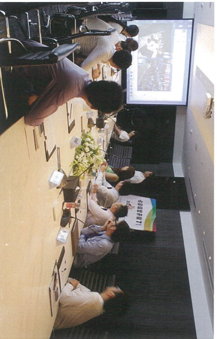
图：首堂线上“七彩课堂”开课

经过一个多月的软硬件升级和设备调试,6 月 10 日,花样年公益基金会第一堂“七彩课堂”线上课堂正式在吉安希望小学和深圳花样年福年广场异地开讲。这标志着旨在关爱农民工子女的教育乐助计划首次实现了网络远程教育,更多偏远山区的乡村儿童可以通过网络远程教育享受到跟城市孩子一样优秀的教师资源、教学资源,为中国的教育公平提供了一个可实现的样本。