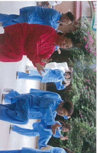
图：太极拳自愿者精彩表演