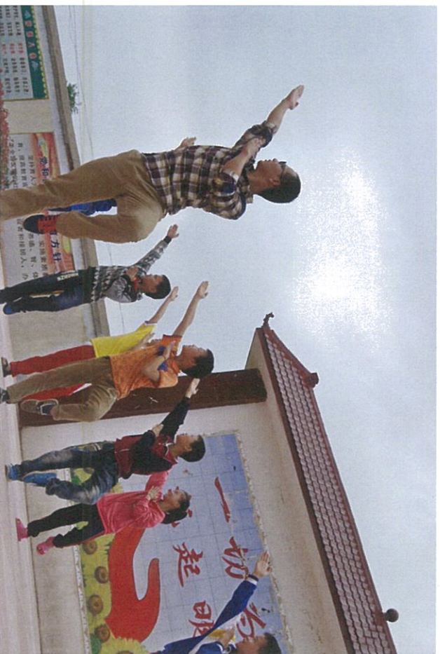
图：迎着朝阳，支教老师与孩子们一起练起了武术

花样年公益基金会已在全国兴建了两所希望小学及 125 所关爱农民工子女阵地——“花样年·七彩小屋”；2013 年，基金会出资百万驰援雅安，组织雅安灾区儿童、吉安希望小学儿童参与城市体验之旅；主办“为爸爸妈妈设计”公益大赛，征集到海内外近 1150 多件适老创意作品；出资设立三个“安康老年养老服务中心”，提供社区养老服务。未来，基金会将持续走向专业化、系统化的道路。