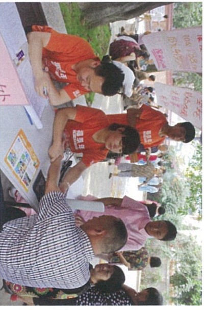
图：活动外场热闹的人群