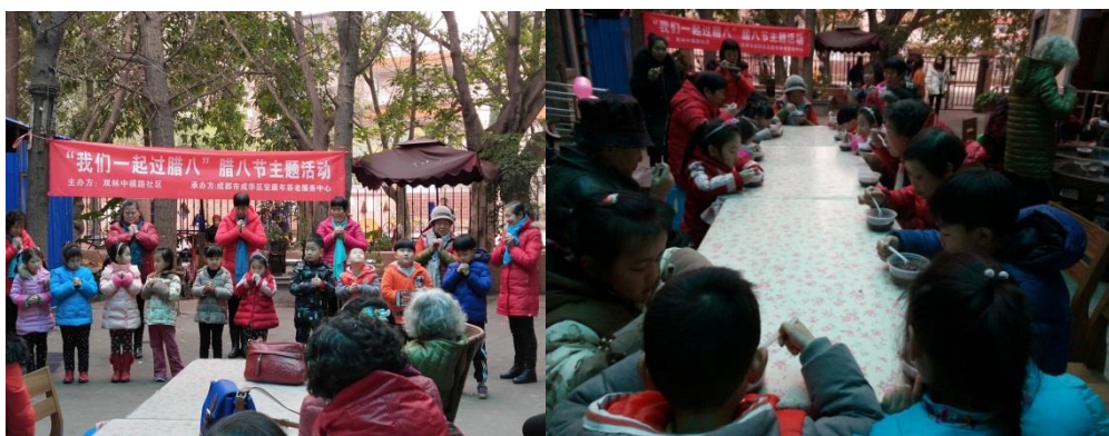
小朋友们表演节目以及分享腊八粥