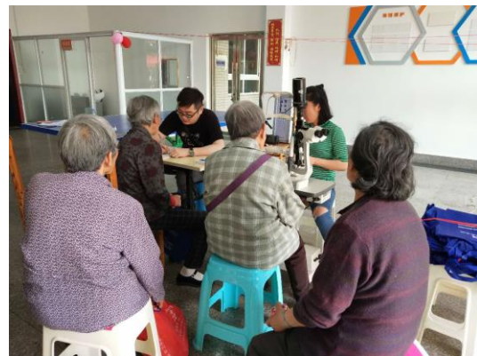
开业体验活动现场