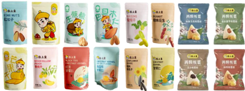
方案二 200元 15款单品 26%配捐