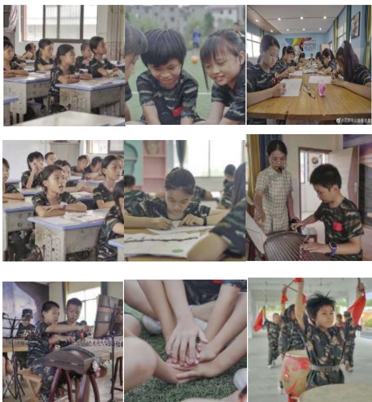
孩子们开启了红色之旅：“童心向党，致敬先辈 ”