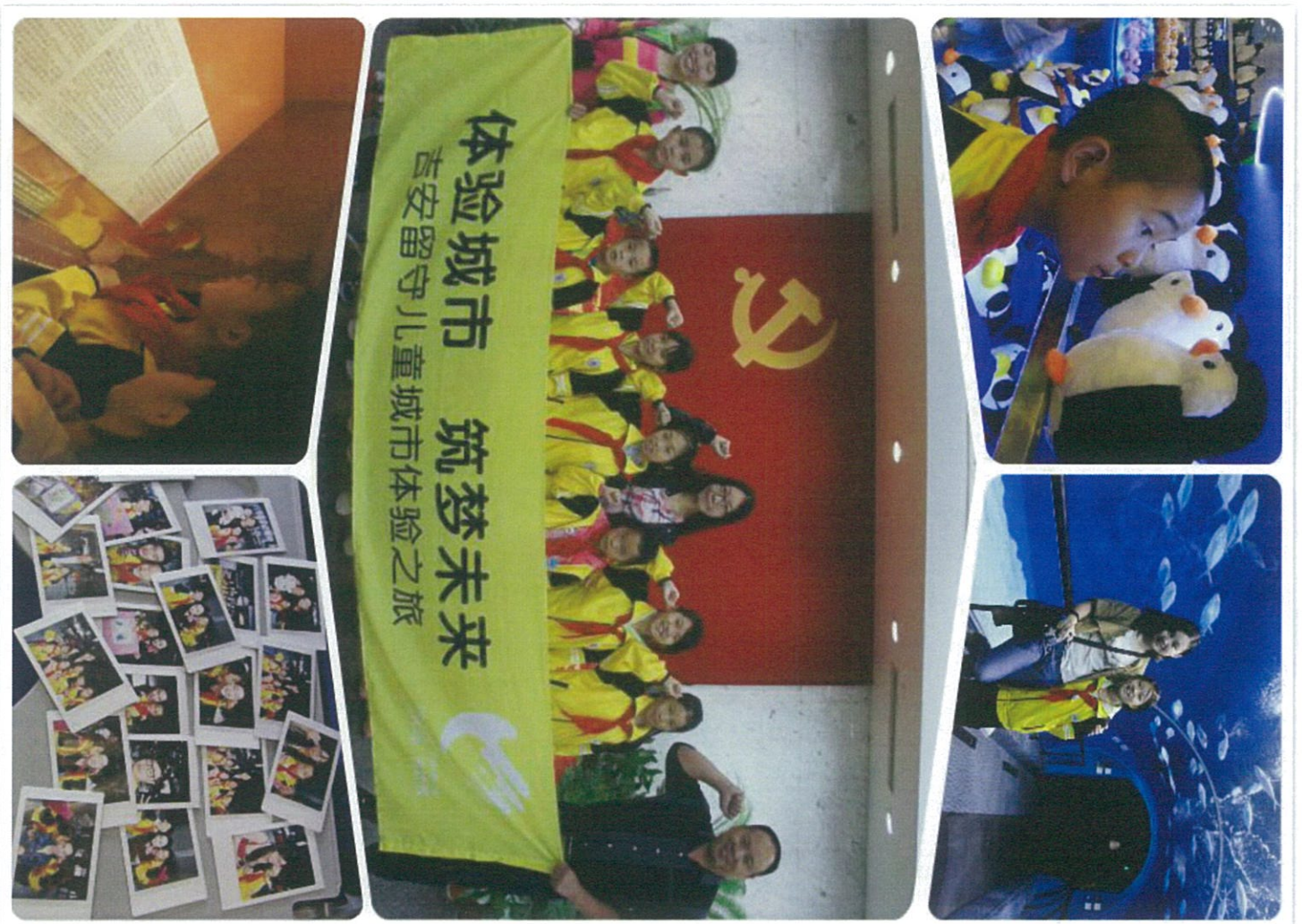
图：体验城市的历史和美好

三天的体验之旅结束了，孩子们将自己手工作品作为礼物赠送给了东航热心的志愿者们。孩子们表示回学校后一定将这段旅程与其他同学分享，今后要好好学习，长大后也要来到城市，成为跟东航的阿姨叔叔们一样愿意并且有能力帮助别人的人。