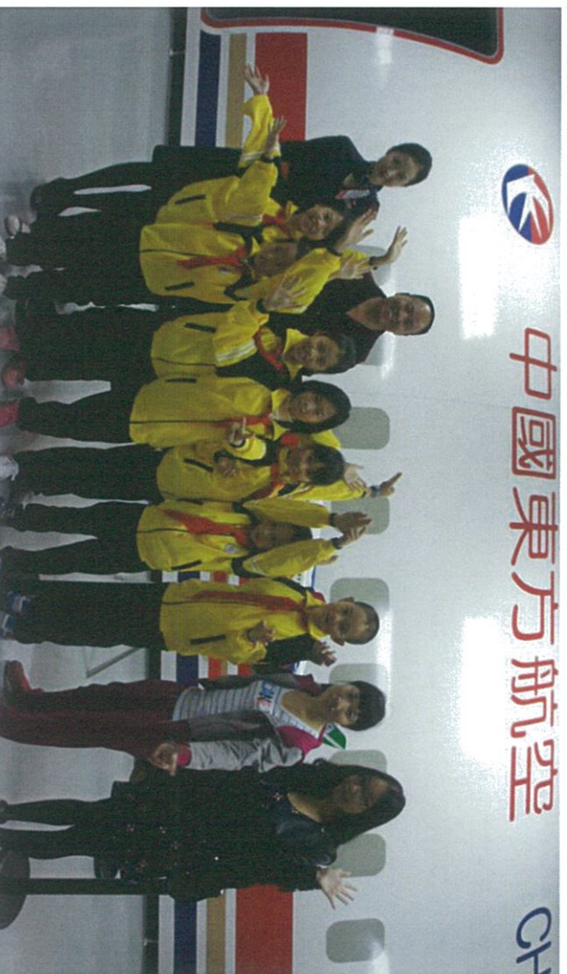
图：吉安希望小学师生参观东航

你是否还记得，第一次去到北京、上海等大城市时的心情？高楼大厦、车水马龙、灯火辉煌，站在宽敞的道路上感受着城市的繁华，也在心中感慨着与城市的距离，而更多的，也许是从这种下一个长大后要与城市相约的梦想。10月底，由东方航空凌燕基金和花样年公益基金会共同主办的“吉安留守儿童体验之旅”举行，7名孩子梦圆东航，前往上海体验父辈打工的城市生活。