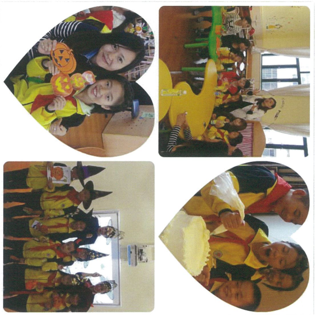
图：与城市小朋友们一起上课和游戏

“城市体验之旅”的最后一天，孩子们还游览了上海城市代表建筑和历史遗址。他们参观了中共一大会址，缅怀革命先烈；在城隍庙美食街品尝美食，橱窗中琳琅满目的商品让他们大开眼界；在海洋馆中穿越空间限制，围观各地的海洋生物；最后一站是金茂大厦，现代高楼的繁华和30秒登上88层的电梯让他们惊叹不已，这种惊叹也伴随着他们极目眺望，俯瞰繁华的上海城。