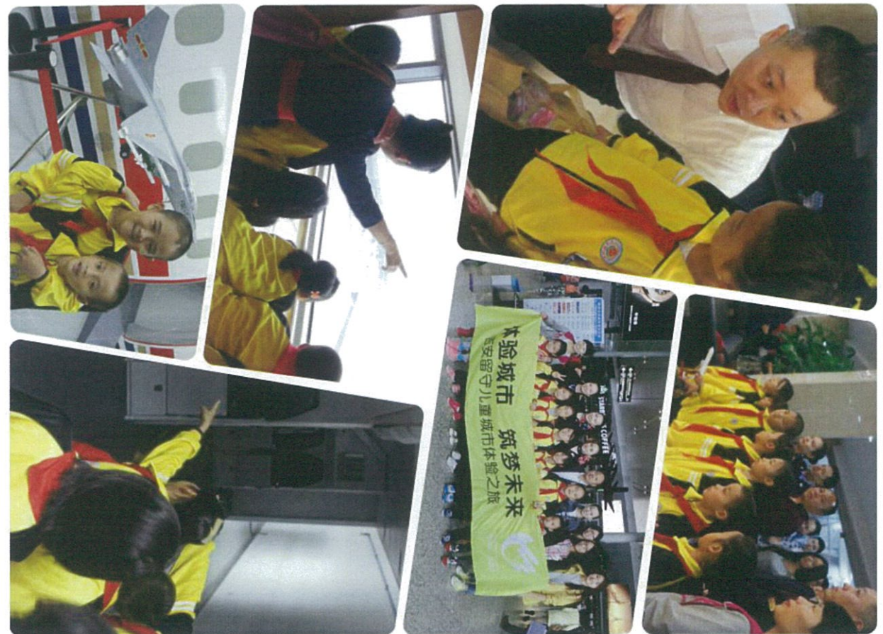
图：孩子们参观东航模拟机体验舱

参与“城市体验之旅”的7名学生中，最大的一位12岁，六年级学生，最小的才8岁，刚上二年级。此前，他们从未走出过家乡吉安。10月30日，孩子们在老师的陪伴下，第一次乘坐飞机前往上海。接下来的三天里，东航志愿者们带孩子们参观了飞机模拟舱，深入了解飞机的结构和运作原理。走进东航食品公司，学习制作蛋糕和花式饺子；参观航华一小和曹杨新村第六幼儿园，与当地的小朋友一起上了一堂趣味手工课。