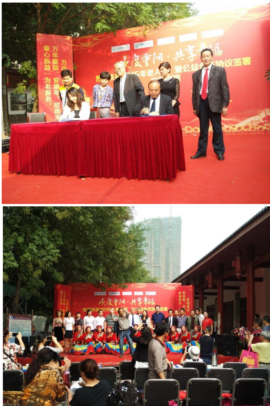
图：“漫步夕阳·共享幸福”的合作签约仪式

11月21日，万年场街道老年人协会协成都万年医院、成都市成华区安康年养老服务中心、欣雨禾幸福享老公社、康欣国际旅行社有限公司在万年场街道老年人服务中心举行了“漫步夕阳·共享幸福”的合作签约仪式。该仪式为了贯彻落实党中央，“五个老有”政策，重视老年人的精神需求，逐步建立多层次的养老服务体系，注重对老年人的日常服务，逐步提高对老年人的优待水平，推进宜居环境建设，保障老年人参与公共事务的权利。通过本次活动，安康年与社会其他养老资源积极连接，共同为社区老人提供更丰富、便捷的养老服务。