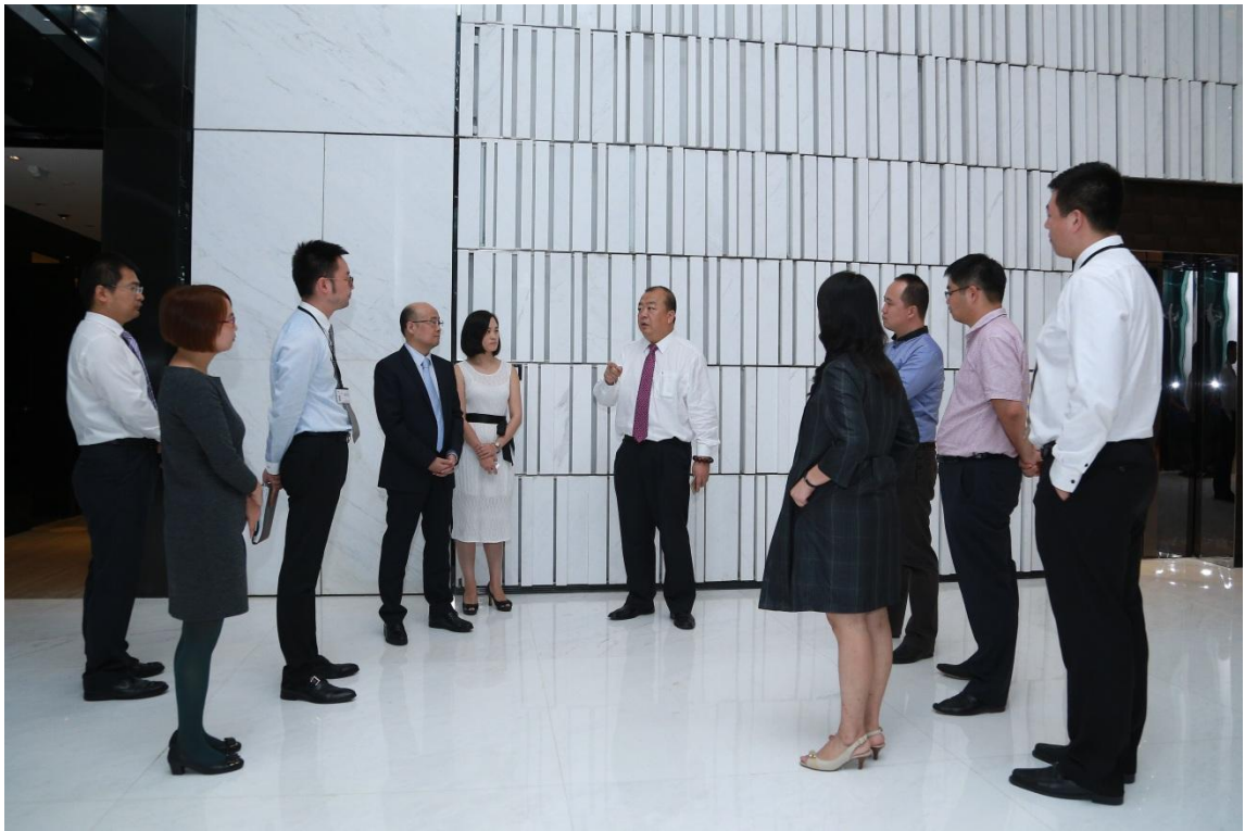
图二：潘总在和评委们分享公益心得