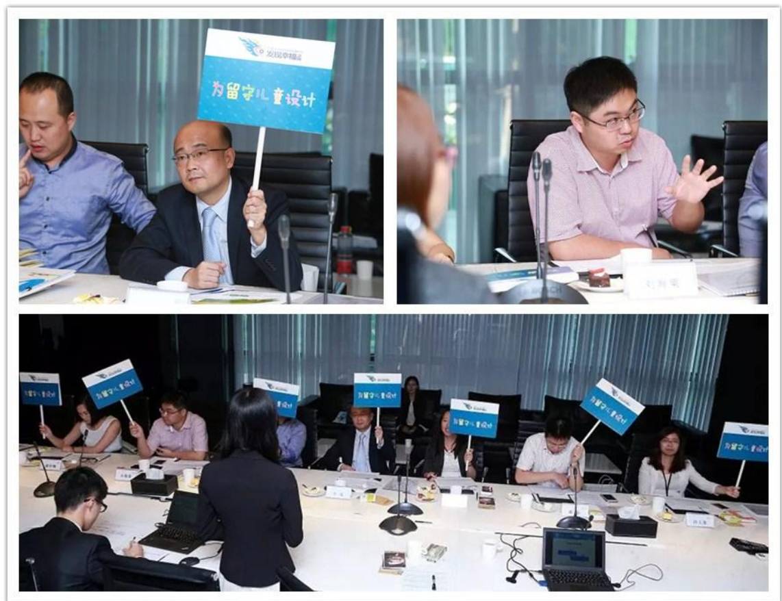
图三：评委们认真地对每一个公益项目进行点评和投票