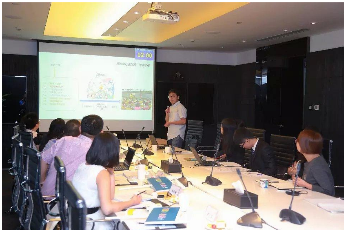
图一：公益组织代表人在演讲竞选项目

随着线下评审进程，留守儿童主题展览同步在深圳福年广场举行。这场公益展览以环保、可持续为理念，所有展品由“公益众筹”而来，为“为留守儿童设计”活动以及花样年公益基金会的教育公益成果。展览还将根据需要，在喜年中心等地进行巡展。