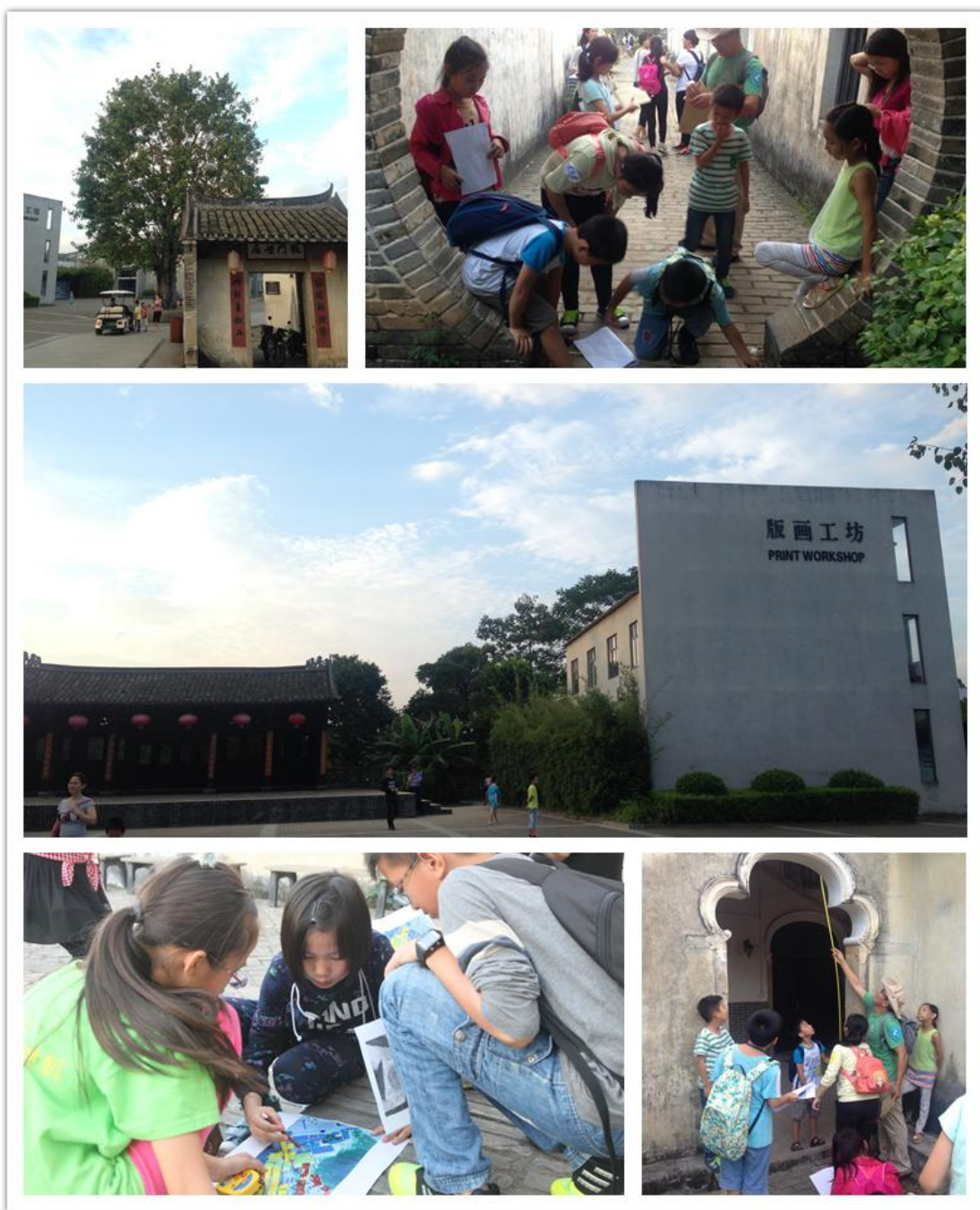
(图：志愿者和孩子们一起进行村落寻宝的游戏)