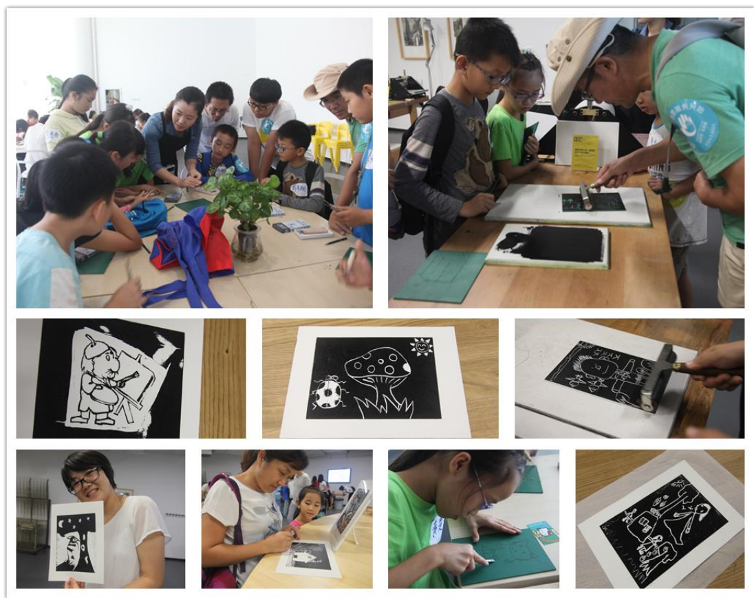
图：志愿者和孩子们一起学习制作版画

参观完中国版画博物馆后，志愿者和孩子们在老师的带领下进行了版画制作，大家都专心致志地投入到创作当中，充满了新奇和期待，出来的作品都充满童真、幸福和想象力~