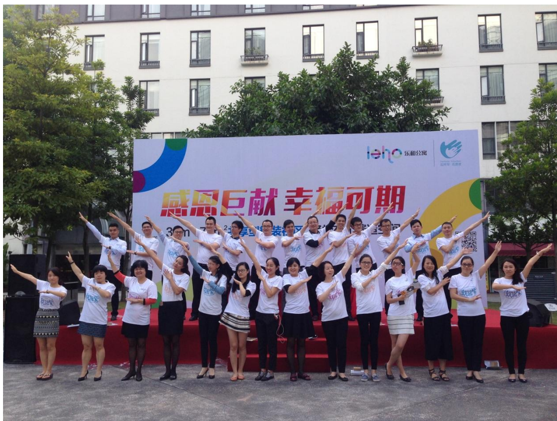
(图：日行一善在美年广场的宣传活动)