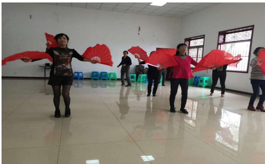
(图：成华区、青羊区和武侯区安康年备战“福泰年”老年才艺大赛)