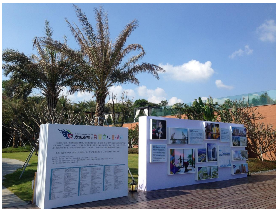
(图：龙岐湾 1 号留守儿童主题展览)