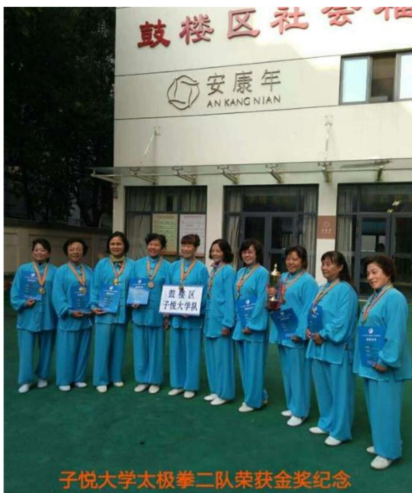
(图：南京鼓楼区安康年荣获“鼓楼区“武术邀请赛两项团体金奖”)