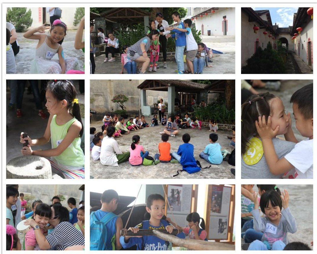
(图：孩子们围绕老师听故事，在戏剧扮演游戏中发挥了宝贵的想象力)