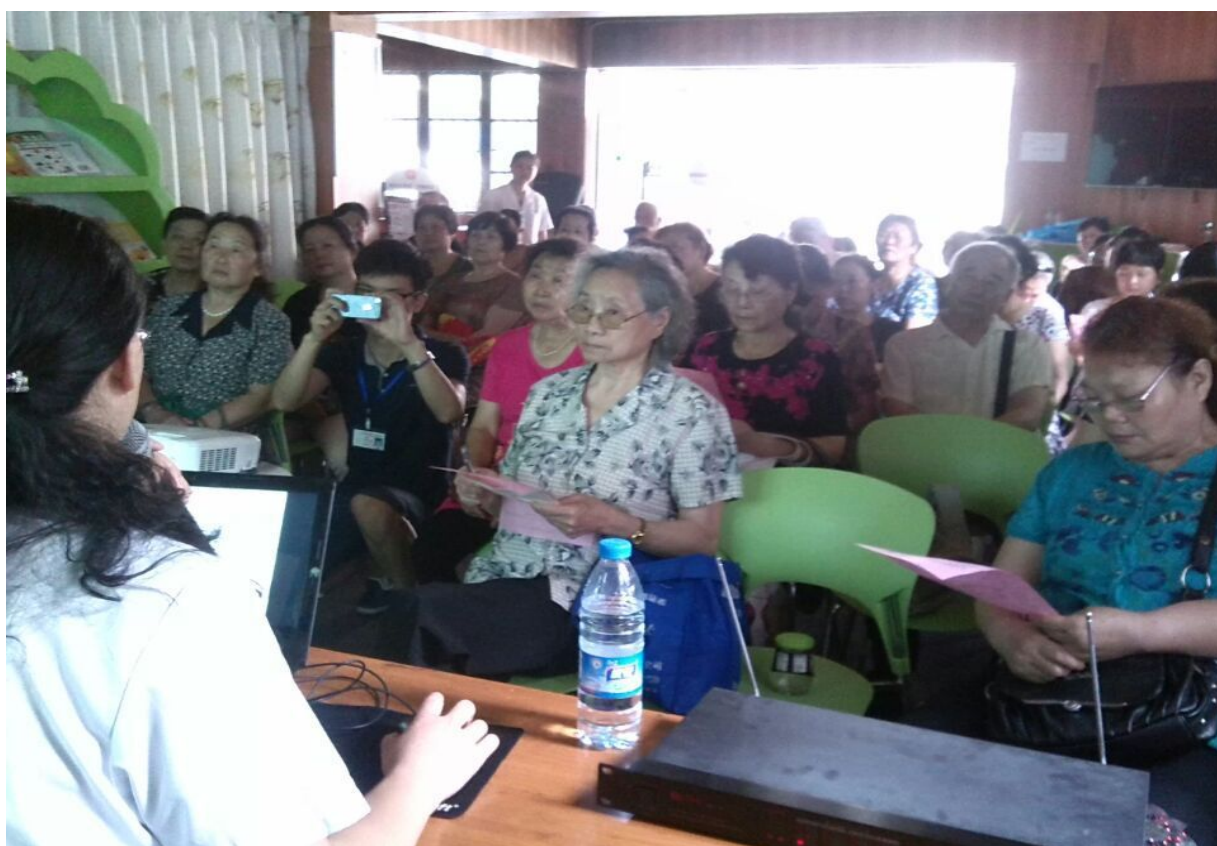
图 2：开展老人健康讲堂