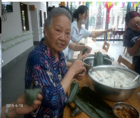
图 3：安康年包粽子活动现场