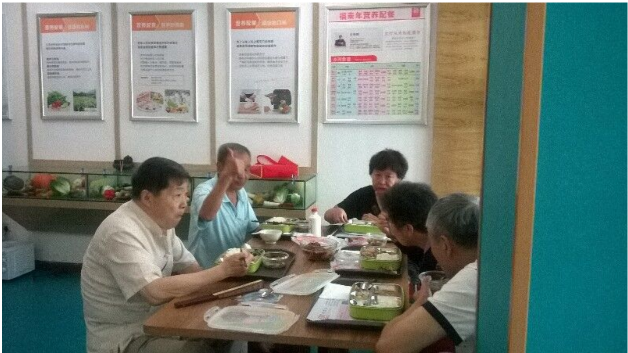
图1：老人为营养配餐点赞