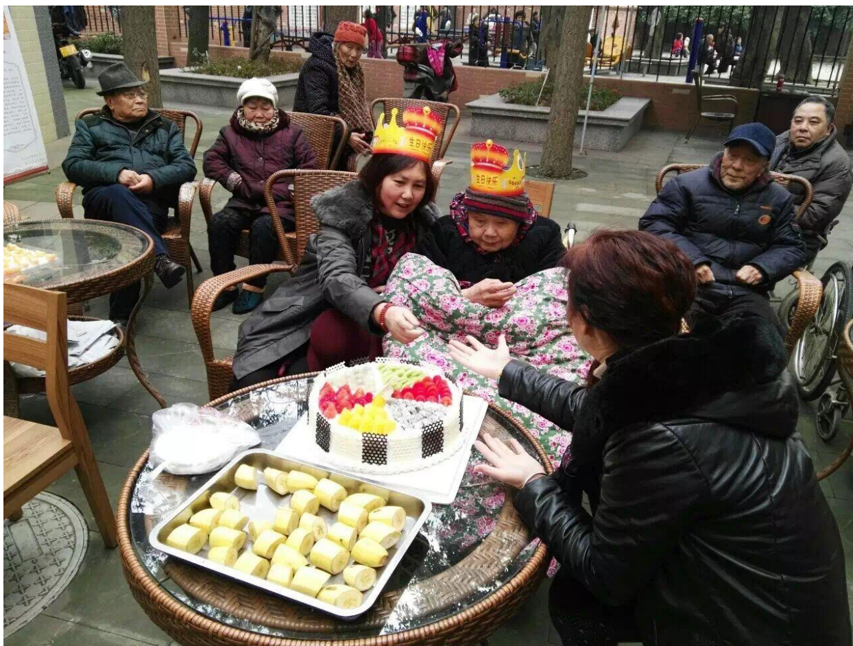
(图：杨婆婆母女幸福依偎在一起)