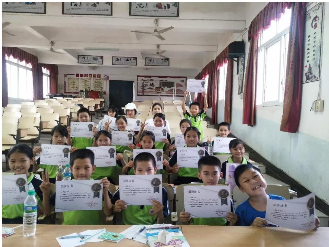
（花 young 夏令营结营啦）

“其实就是城市的大孩子和乡村的小朋友一起玩，家长们做好后勤支持工作，教学内容和教授方式交给支教的大孩子（支教老师），我们不做过多干预。事实上，支教的大孩子们也不喜欢我们干预，甚至是围观”。据“青青乡村夏校”申总介绍，平日他们工作都比较忙，没有太多时间和孩子深度沟通。陪伴孩子一起去乡下支教，是他们家一年之中最为重要的活动，是一年中最为宝贵的亲子陪伴时光，他们的孩子从中收获了很多，变得更为开放、有责任心和爱护他人，“善良是人最重要的品质，乡村支教的方式让我们收获了善良”。